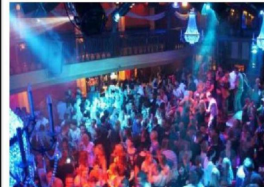
natte horeca & discotheken